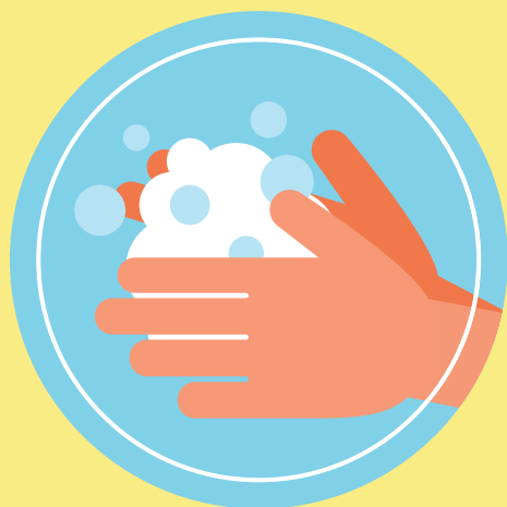
LAVADO DE MANOS

“ LOS LOCALES DEBERÁN TRABAJAR A UN 50% DE SU CAPACIDAD.