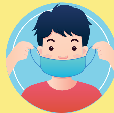
INGRESO AL ESTABLECIMIENTO CON BARBIJO